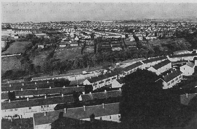
Bild 1. Die Zeiten, in denen die Luft Sheffield durch Rauch- und Nebelschwaden verdorben war, sind längst vorbei. Auf dieser Aufnahme kann man den Horizont auf eine Weise sehen, wie es vor Inkrafttreten der Rauchbekämpfung nur äusserst selten möglich war

bezahlt einen Anteil an die Kosten des Komitees. Eine kleine Gruppe von Fachleuten steht vollamtlich im Dienste desselben.