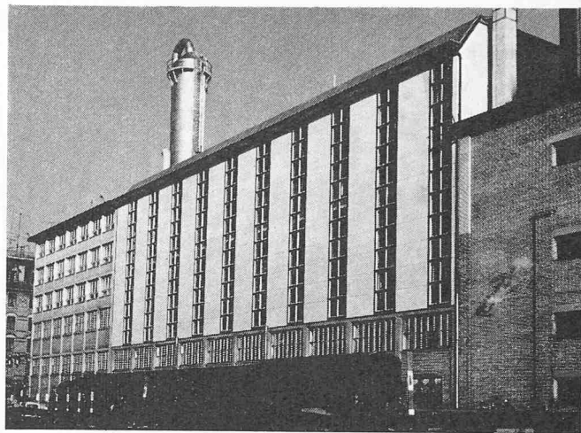
Bild 3. Ansicht von der Hardstrasse

Da die Wandelemente Polymur und Fenster in sehr grossen Teilstücken hergestellt wurden, konnte die Stahl-