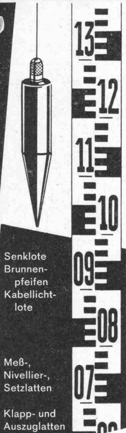
Senkrote Brunnen- pfeifen Kabellicht- lote