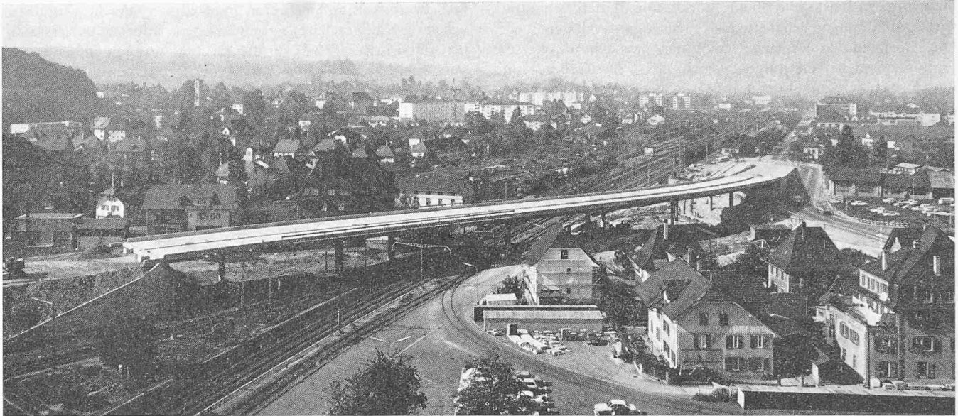
Überführungsbauwerk Aarmatt in Zuchwil