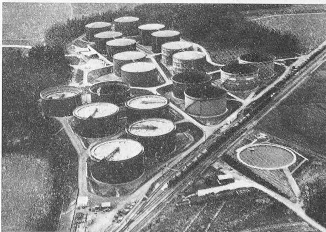
Gesamtansicht der Grosstankanlage der Carbura in Altishausen

Im Hinblick auf einen Brandausbruch oder andere Katastrophen ist die Anlage weitgehend unabhängig von Wasser-