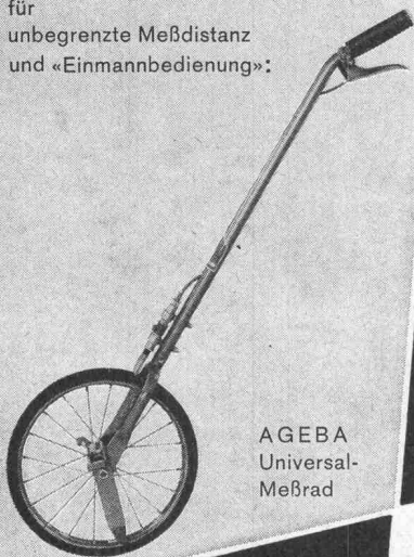
AGEBA Universal- Meßrad

für unbegrenzte Meßdistanz und «Einmannbedienung»: