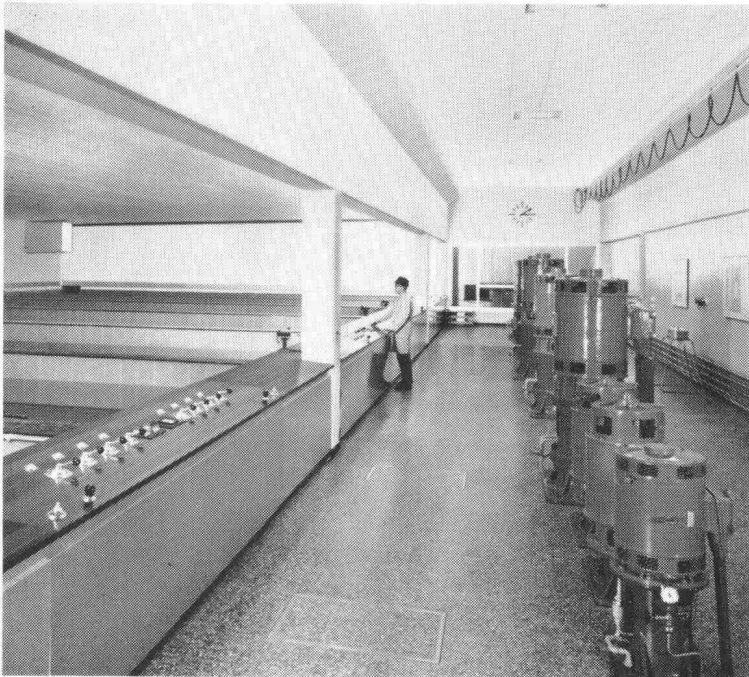
Schnellfilteranlage «Champ-Bougin» der Stadt Neuenburg für das Aufbereiten von Seewasser zu Trinkwasser. Leistung 1800 m 3 /h