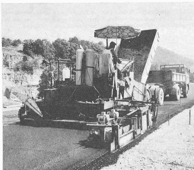
Bild 1. Elektrohydraulisch gesteuerter Fertiger im Einsatz. Im Vordergrund ist die Abtast-Steuereinrichtung sichtbar

Der Aufbau von Heissmischtragschichten besteht zu rund 96 Gew. % aus kornabgestuften Gesteinskomponenten und zu rund 4 % aus hochviskosem, bituminösem Bindemittel. Die genaue Zusammensetzung erfolgt auf Grund