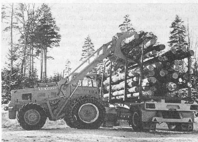
Bild 2. Lader Typ LM 840 ausgerüstet mit einem Sonder-Kippgreifer für Rundholz, Rohre usw.

staunlich. Noch 1961 belief sich der gesamte Umsatz von BM-Volvo auf 260 Mio Kronen, was ungefähr 194,4 Mio Fr. entspricht. Der Anteil des Exportes betrug damals rund ein Viertel der gesamten Produktion. Das Geschäftsjahr 1969 konnte mit einem Umsatz von 470,4 Mio Fr. abgeschlossen werden; in diesem Jahr belief sich der Anteil des Exportes auf 260 Mio Fr., also bereits rund 53 % des gesamten Umsatzes. Bolinder-Munktell hofft, bis 1975 die 1-Mia-Kronen-Grenze überschreiten zu können, wobei praktisch die ganze zusätzliche Produktion – man rechnet vor allem mit einem Anstieg auf den Sektoren Bau- und Forstmaschinen – im Ausland müsste abgesetzt werden können.