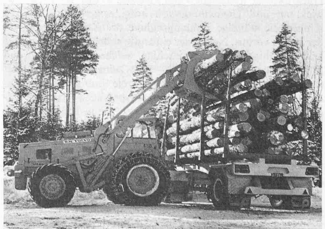
Bild 2. Lader Typ LM 840 ausgerüstet mit einem Sonder-Kippgreifer für Rundholz, Rohre usw.

staunlich. Noch 1961 belief sich der gesamte Umsatz von BM-Volvo auf 260 Mio Kronen, was ungefähr 194,4 Mio Fr. entspricht. Der Anteil des Exportes betrug damals rund ein Viertel der gesamten Produktion. Das Geschäftsjahr 1969 konnte mit einem Umsatz von 470,4 Mio Fr. abgeschlossen werden; in diesem Jahr belief sich der Anteil des Exportes auf 260 Mio Fr., also bereits rund 53 % des gesamten Umsatzes. Bolinder-Munktell hofft, bis 1975 die 1-Mia-Kronen-Grenze überschreiten zu können, wobei praktisch die ganze zusätzliche Produktion – man rechnet vor allem mit einem Anstieg auf den Sektoren Bau- und Forstmaschinen – im Ausland müsste abgesetzt werden können.