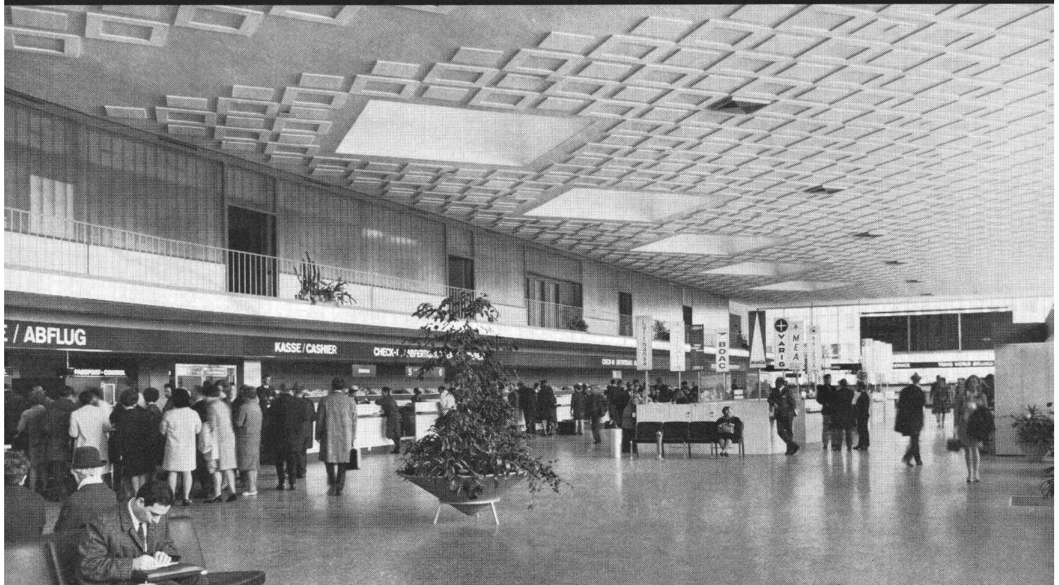
Flughafen Zürich Abflughalle Trakt Nord Bauleitung: Flughafen-Immobilien-Gesellschaft, Zürich