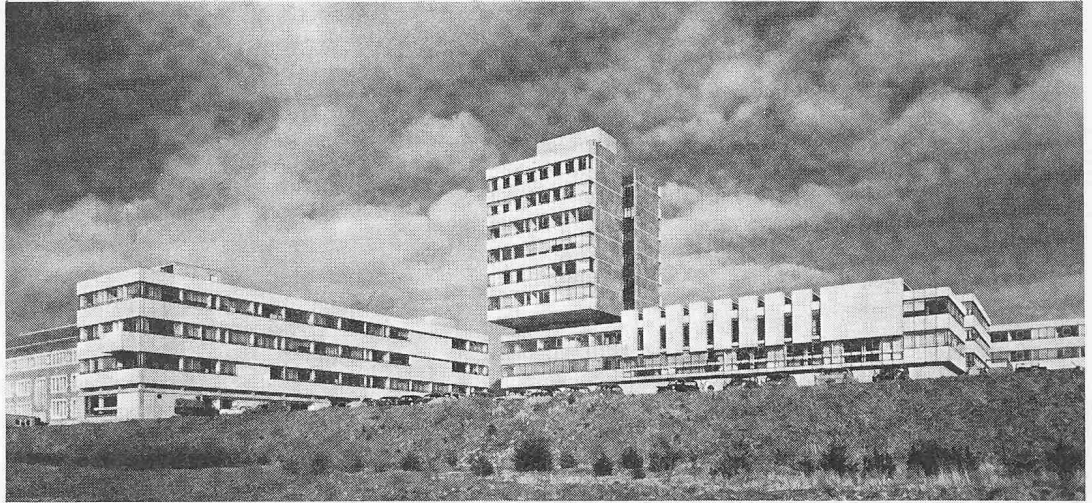
Eines der vier Kollegien der Universität von Wales ist Aberystwyth , abseits einer Industriestadt, über der Bucht des Strandkurortes Cardigan. Das Bild zeigt Erweiterungsbauten, deren zehnstöckiger Trakt einen Teil der sozialwissenschaftlichen Fakultät, Geologie- und Geographieabteilungen sowie Turn- und Sporthallen enthält (Architekt: Sir Percy Thomas)

Medizinische Fakultäten und Kliniken sowie Planungssysteme für Lehr- und Forschungsbauten.