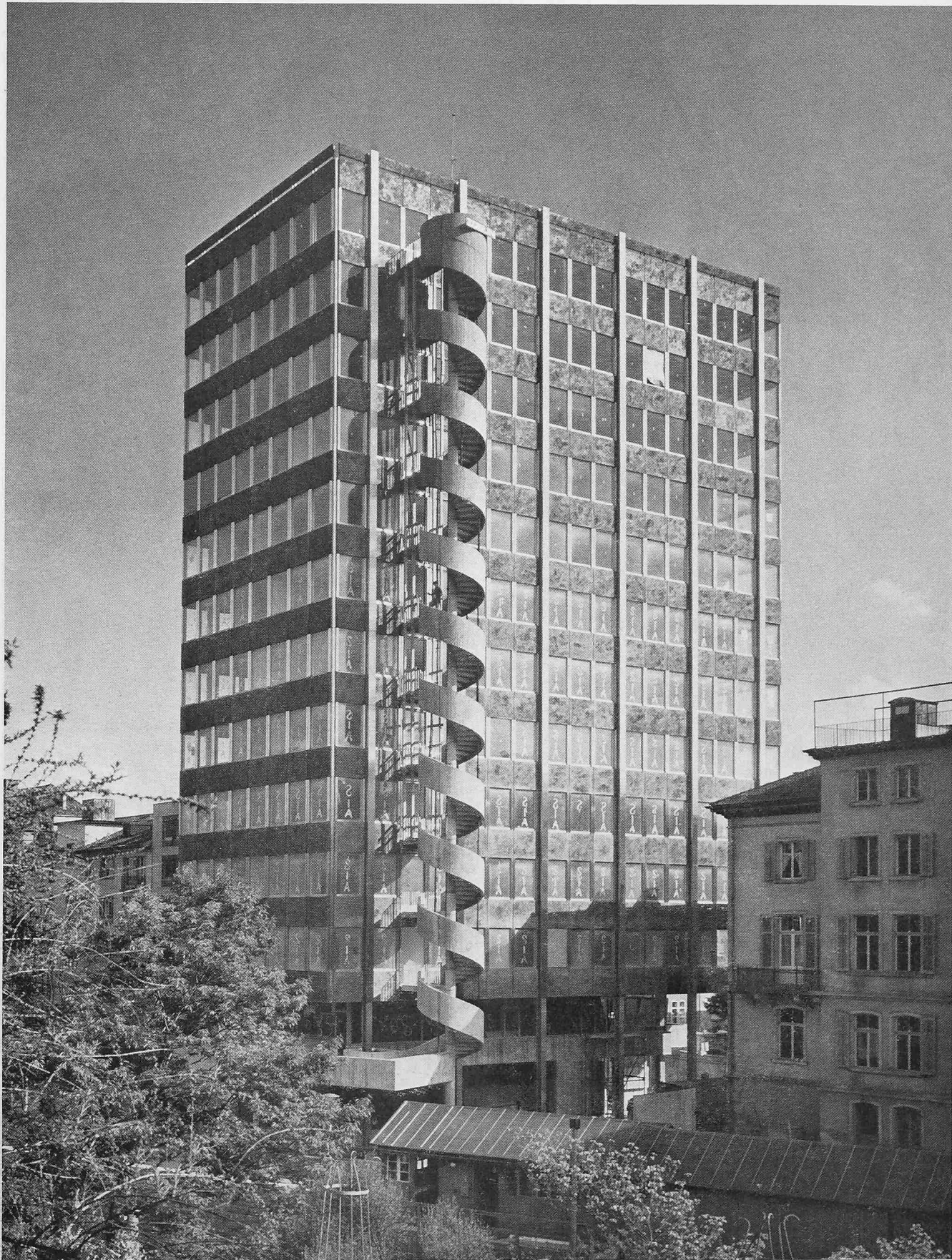
Ansicht des SIA-Hauses aus Norden