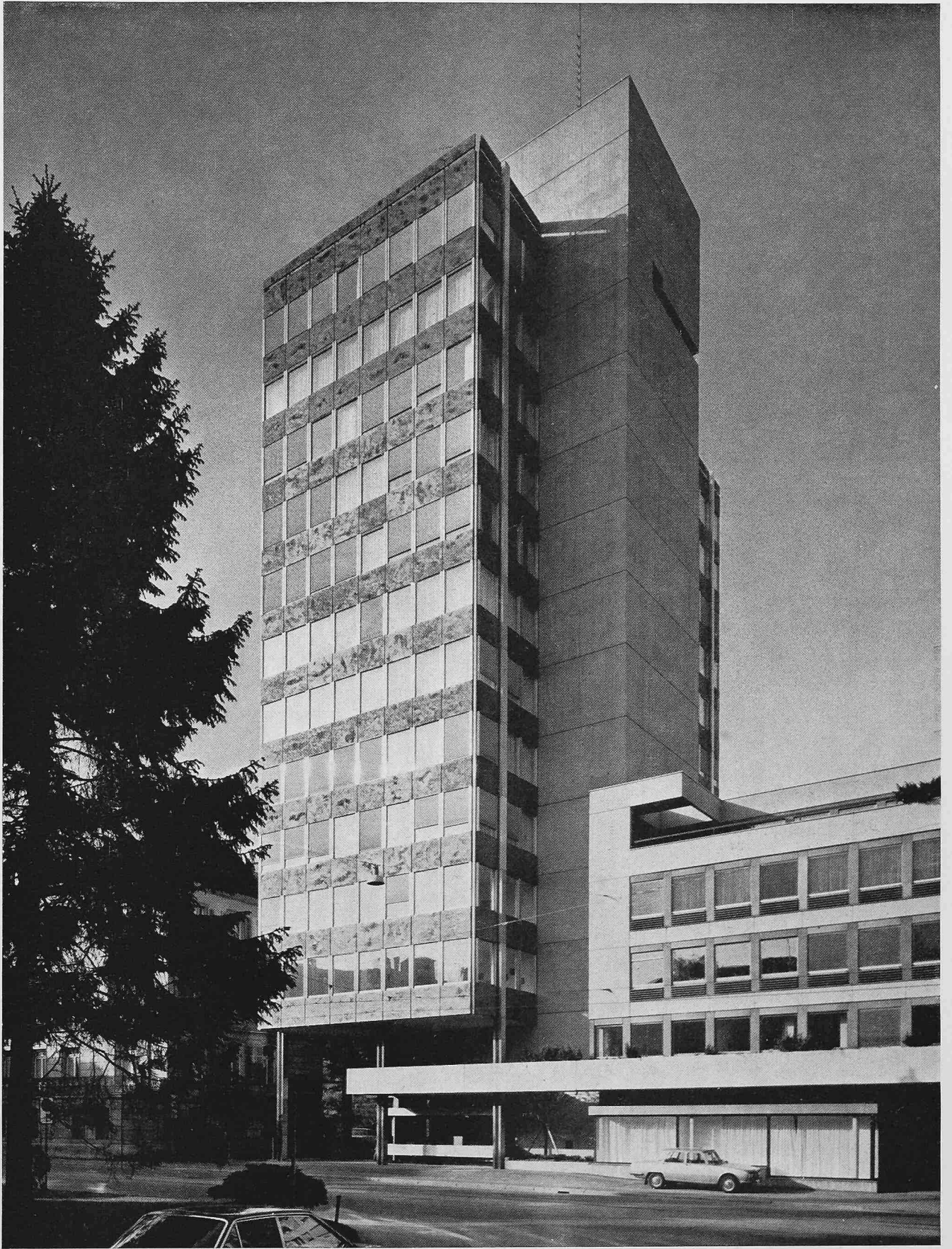
Fassade an der Selnastrasse, rechts das von den gleichen Architekten gleichzeitig erstellte Wohn- und Geschäftshaus Selnastrasse 12