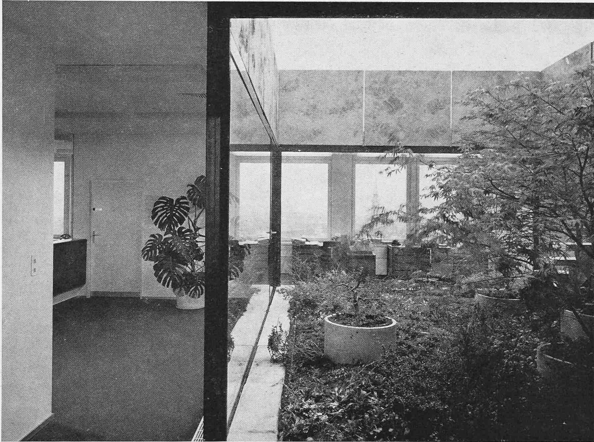
Offenes Atrium mit Ziergarten im 12. Geschoss (SIA-Generalsekretariat)