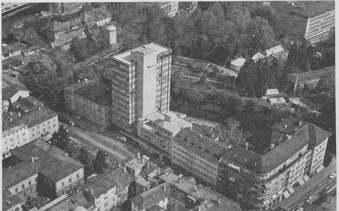
Die Baugruppe SIA-Haus und Selmaustrasse 12; hin- ten der Botanische Garten. Flugbild Swissair aus Süd- südwest