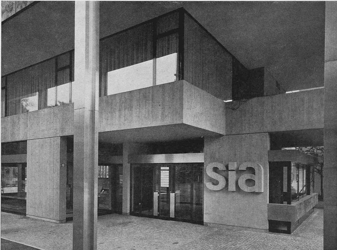
Eingang an der Selnastrasse mit SIA-Emblem von Franz Purtschert. Links das im Ausbau begriffene Restaurant