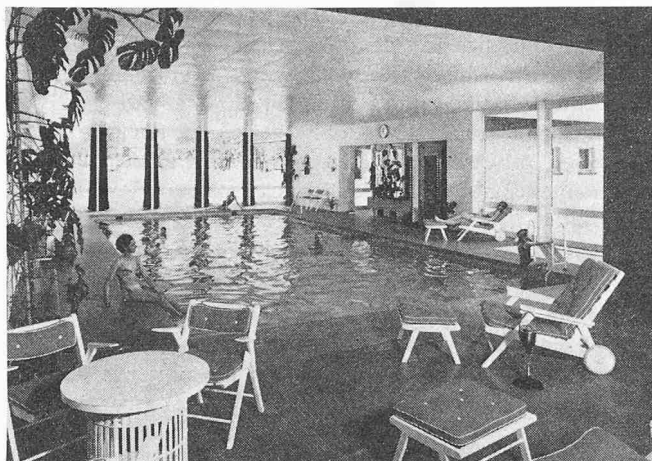
Hotelschwimmhalle in Grindelwald, ausgerüstet mit Deckenstrahlungsheizung

Heizkörpern treten nicht auf. Werden Turnhallen künstlich belüftet, so kann die aufbereitete Luft gleichmässig durch die Schlitzlöcher zwischen den einzelnen Platten eingeblasen werden. Die verbrauchte Luft wird dann unter den Fenstern abgesogen. Gleichzeitig wird die an den Fenstern abfallende Kaltluft mit abgesogen. Zugserscheinungen im Raum werden dadurch vermieden. Der Heizungs- bzw. der Kühlbedarf wird durch die Decke getragen, so dass die Aggregate für die Luftaufbereitung entsprechend kleiner gewählt werden können.