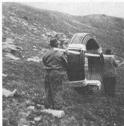
Bild 4. Transport einer Rolle Polyäthylenrohre von 200 m, Durchmesser 50 mm, in den Bergen