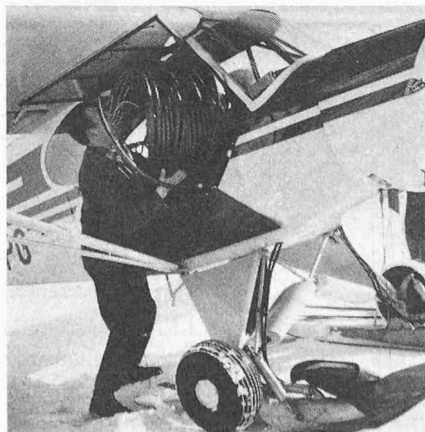
Bild 5. Der verstorbene Gletscherpilot Hermann Geiger beim Ausladen von Weichpolyäthylenrohren auf der Alp Anzeindaz