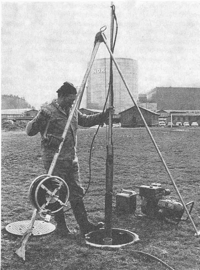
Grundwasseruntersuchungen. Absenken der Unterwasserpumpe in ein Kontrollrohr zwecks Entnahme von Grundwasser für die vierteljährlichen chemischen Analysen. Im Hintergrund Reaktorgebäude und Maschinenhaus des Atomkraftwerkes Beznau II