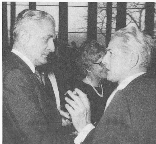
Zentralpräsident Neininger dankt Bundesrat Brugger für die Festansprache

Der Wille zum Dienst an der menschlichen Gesellschaft setzt voraus, dass der einzuschlagende Kurs gemeinschaftlich festgelegt wird. Hier äussert sich die Verpflichtung des Technikers, die Zusammenhänge darzulegen, mit anderen Fachleuten zusammenzuarbeiten, um in der Art eines Mosaiks ein möglichst ganzheitliches Bild als Entscheidungsgrundlage entstehen zu lassen. Der weitere Fortschritt darf nicht mehr durch Einzelleistungen, sondern muss durch enge Zusammenarbeit in Gruppen erreicht werden. Diese Zusammenarbeit ergibt sich aber nicht von selbst, sondern sie muss gesucht, gewollt, ja sogar erkämpft werden.