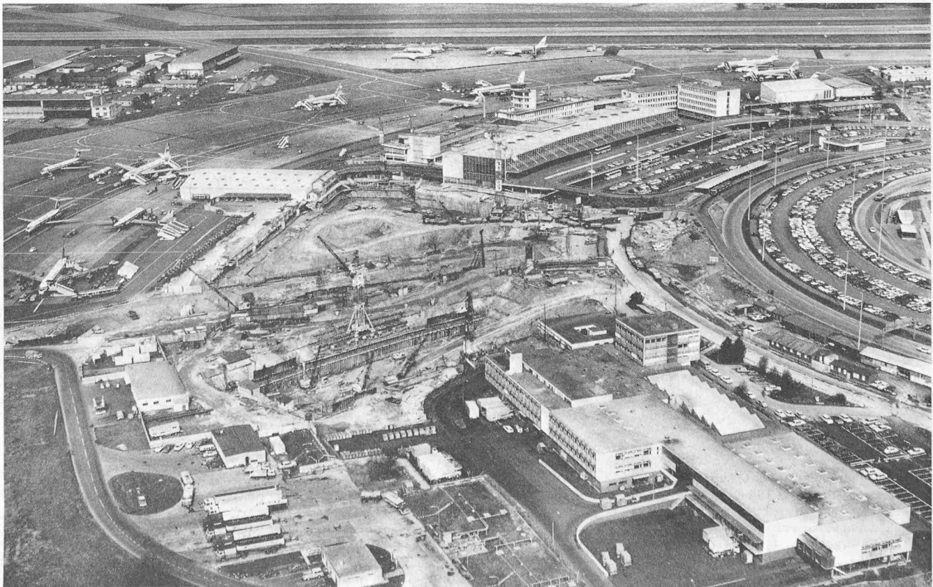
Luftaufnahme des Flughafens Zürich aus Süden. Im Vordergrund das Borddienstgebäude, in Bildmitte die Baustelle der künftigen Station der SBB (im Volksmund «das grosse Loch» genannt). Darüber wird später das erste der im Rahmen der dritten Baustappe geplanten Fingerdocks erstellt. Das Borddienstgebäude wird später den neuen Abfertigungsanlagen weichen müssen. Links neben dem Flughafen die provisorische Abfertigungshalle für Grossraumflugzeuge. Aufgenommen am 6. März 1972