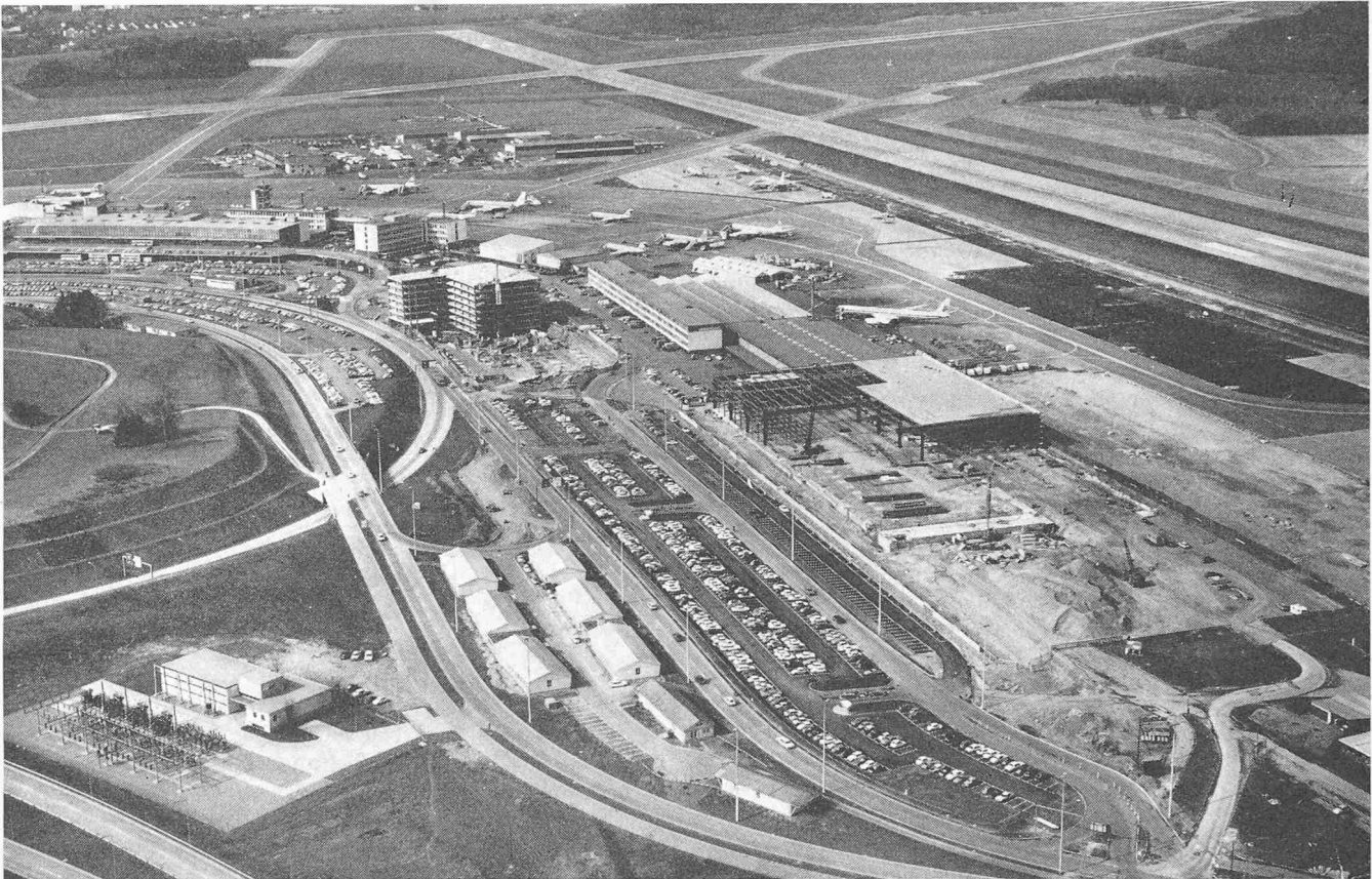
Luftaufnahme des Flughafens Zürich aus Osten. Im Vordergrund die Baustelle der neuen Frachthalle, in Bildmitte das erste Parkhaus im Rahmen der dritten Baustappe. Links der Flughafen. Bauzustand 6. März 1972