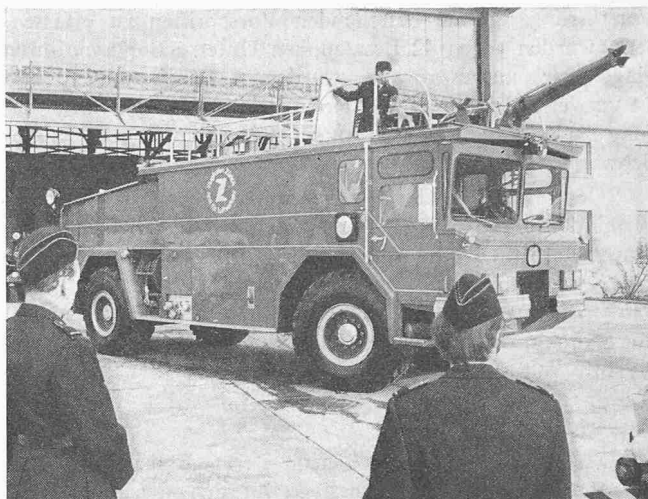
Ein Löschfahrzeug der Flughafenfeuerwehr

Im Frachtverkehr halten sich die Gewichte der ankommenden und abfliegenden Fracht die Waage. Wenn auch der Zuwachs mit 1665 t im Jahre 1971 bescheiden ausgefallen ist, so entspricht dieser Zuwachs allein gleichwohl der im Jahre 1949, dem ersten vollen Betriebsjahr in Kloten, umgeschlagenen Frachtmenge. Gering scheint auf den ersten Blick auch das Gewicht der Luftpost, doch darf man nicht ausser acht