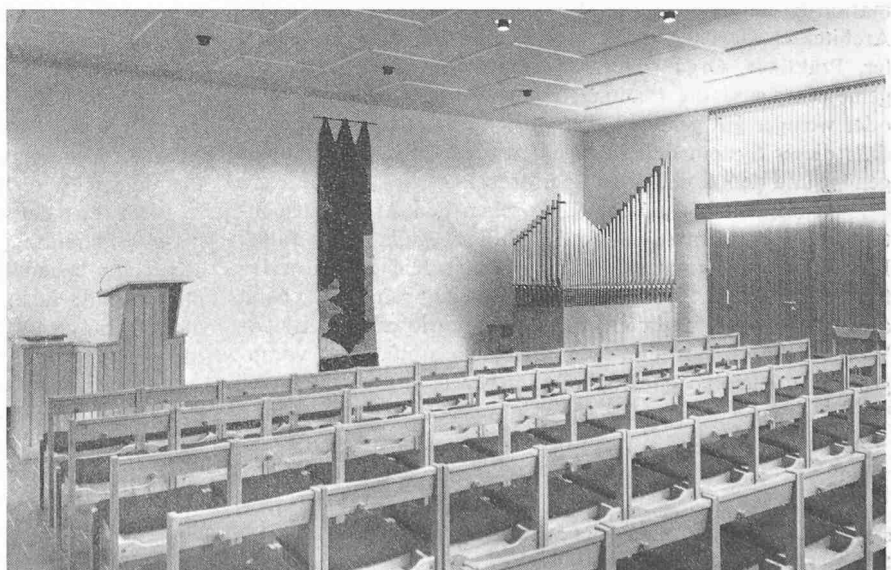
Inneres der Abdankungskapelle