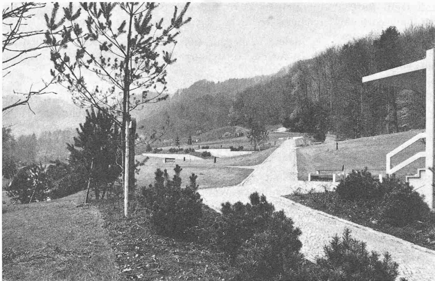
Blick vom erhöht gelegenen Friedhofgebäude gegen Süden mit dem Haupteintrittsweg