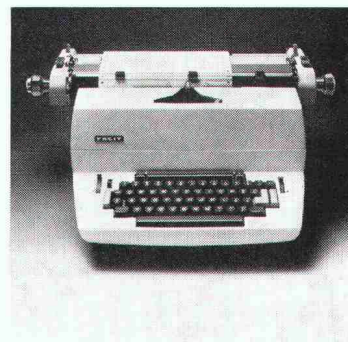
Ausgabe-Schreibmaschine Modell 9861A für die programmierte Ausgabe von Resultaten in Tabellenform.

Dieser einzigartige Tischrechner ist jederzeit und sofort zur Arbeits- und Datenaufnahme bereit. Wann und wo immer Sie ihn brauchen. Sie sind also unabhängig und können unvermeidbare Wartefristen von Servicebüros überbrücken.