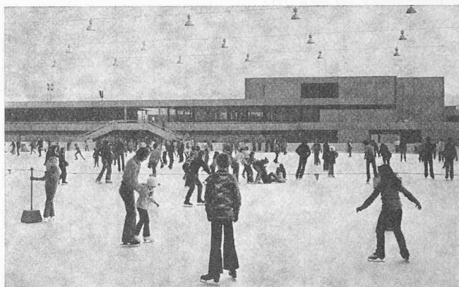
Die Kunsteisbahn im Betrieb (anfangs 1972)

bis 0 Stunden am Schluss des Betonierens. Ein Bespritzen der noch frischen Betonoberfläche mit einem chemischen Nachbehandlungsmittel verzögerte den Austrocknungsprozess.