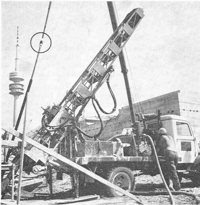
Bild 3. Das Einbringen der Injektionszuganker Stump-Duplex. Die Bohrlafette ist auf einem Lastwagen montiert. Am Ausleger eines Autokrans hängt der Erdanker. Im Kreis ist die Stump'sche Ankerblase zu erkennen. Im Hintergrund der Fernsehturm

Bohrung eingebracht. Die Bestandteile des Ankers sind im wesentlichen der eingliedrige, 3fach kunststoffbeschichtete Spannstahl St 85/105, Durchmesser 32 mm, mit an beiden Enden aufgerollten Gewinden, das 3,5 m lange profilierte Haftrohr mit Endmuffe für den Ankerstahl, das den beschichteten Stahl vor mechanischen Beschädigungen schützende Plastikhüllrohr, das zugleich die freie Beweglichkeit des Stahlzugglieders gewährleistet, und die oberhalb des Haftrohres angebrachte Stump'sche Ankerblase. Nach dem Ziehen der Verrohrung bis zum Ende der vorgesehenen Krafteinleitungsstrecke wurde die Zementschlämme unter hohem Druck verpresst. Danach wurde die Ankerblase mit Wasser aufgepumpt, so dass sie sich an die Bohrlochwand andrückte. Dadurch wurde die im Bohrloch stehende Zementsäule unterbrochen und die gewünschte Begrenzung der Krafteinleitungsstrecke erreicht. Von besonderer Bedeutung war diese genaue Trennung in den Bereichen, wo die Krafteintragungsstrecke in tertiären sandigen