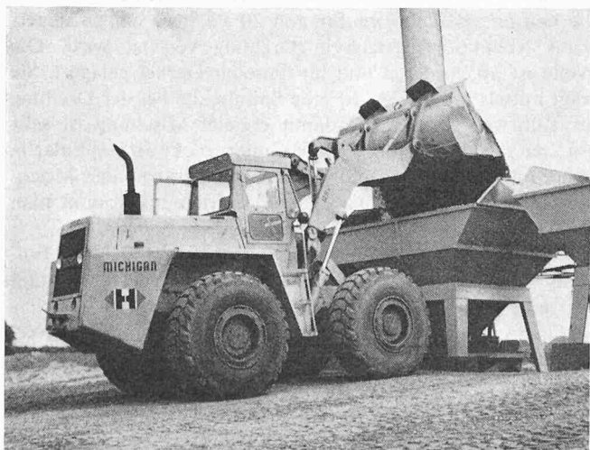
Bild 1. Mit einem schnellen Schaufellader können mehrere Silos einer durchschnittlich grossen Anlage beschickt werden. Dieser Clark Michigan versorgt die Auffangsilos einer Asphaltmischanlage mit 230 t/h Leistung