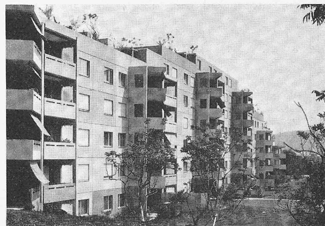
Überbauung «Sonnhalde», Adlikon-Regensdorf ZH, 577 Wohnungen Architekt: Steiger, Architektur- und Planungsbüro, Zürich Ingenieur für Vorfabrikation: Igéco AG, Volketswil ZH