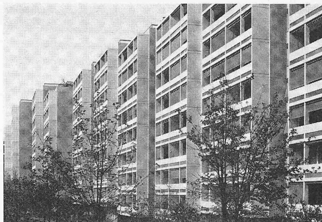
Überbauung «Giacometti-Strasse», Bern, 219 Wohnungen Architekt: Ch. Nauer und K. Scheurer, Bern Ingenieur: J. Bächtold, J.-D. Robert & Co., Bern Igéco AG, Lyssach BE

Ein gleichmässiger Absatz bedarf grösserer Serien . Auch wenn dem heutigen Trend, eher von Grossüberbauungen abzukommen, gefolgt wird, kann diese Voraussetzung erfüllt werden. Schon vor Jahren hat der Delegierte des Bundesrates