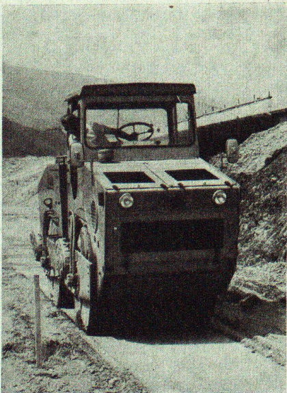
Die knickgelenkte Clark-Scheid-Doppelvibrationswalze DV 100

Etwa 100 000 m 3 Material waren im Zuge der Neutrassierung eines Landstrassenteilstücks im Bereich einer Kreuzung unweit der