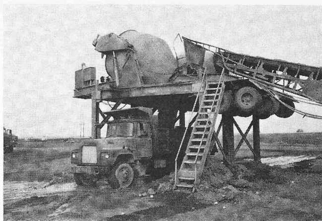
Bild 11. Diese Mischer laden abwechselnd die Betontransportwagen, welche je 10 cu yards ( 7,7\text{ m}^3 ) fassen. Die Transportbänder bringen das Material zu den Mixern, welche automatisch in richtiger Reihenfolge die Transport-«Trucks» beladen