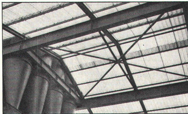
Neomat-Lichtdach auf einer Siloanlage