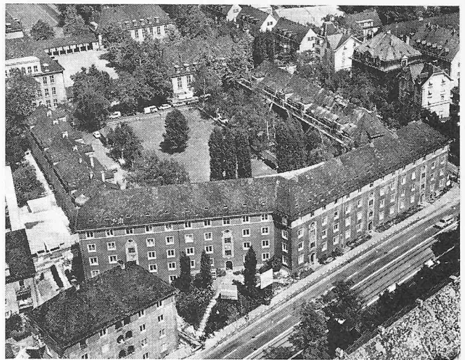
Die in Sanierung befindliche Wohnkolonie «Im Birkenhof» in Zürich Unterstrass (erbaut 1926, 101 Wohnungen)

«Der Ruf der Westtangente ist denkbar schlecht . Die Immissionen, die sie für die Anwohner bringt, übersteigen auf einzelnen Strecken das zumutbare Mass, und die städtebauliche ‚Wunde‘, die der Strassenzug vor allem in Wipkingen aufgerissen hat, ist noch nicht geheilt. Die Aufgaben, die sich hier stellen, sind gewiss nicht unlösbar, aber noch neu; teils mangelt es an den gesetzlichen Grundlagen, und vor allem fehlt – Behörden und Anwohnern – noch die Erfahrung. Immerhin sind nun Messungen und Versuche mit Doppelverglasungen im Gange; noch weniger scheint leider die Möglichkeit von Zweckänderungen besonders stark betroffener Häuser und Umsiedlungen untersucht zu werden. Eine wirksame und zielstrebige Politik auf diesem Gebiet ist dringend nötig.»