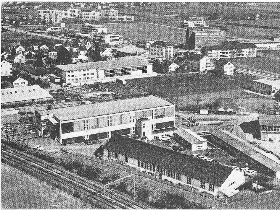
«Misshandelte Landschaft, bauverschmutzte, verluterte Umwelt» (aus einer Bauordnung: Neu- und Umbauten sowie Aussenrenovationen jeder Art sind im ganzen und in ihren einzelnen Teilen so zu gestalten, dass eine befriedigende Gesamtwirkung gewährleistet ist...) Dietlikon ZH (Bild 40)

Nur schon als Konzentrat der Hässlichkeit, der Unmenschlichkeit heutigen Bauens wäre Kellers Buch wertvoll. Doch es ist mehr: Denn wir sind in vielen Fällen gar nicht mehr fähig, das Ausmass der Zerstörung zu sehen, weil der Mensch nicht nur seine Umwelt prägt, sondern selbst von dieser Umwelt geprägt wird, ist seine Immunität gegenüber einer hässlichen, einer krankmachenden Umwelt im höchsten Masse gefährlich.