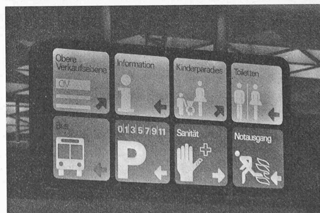
Baugraphik: interne Wegweiser mittels beleuchteten Pictogrammtafeln