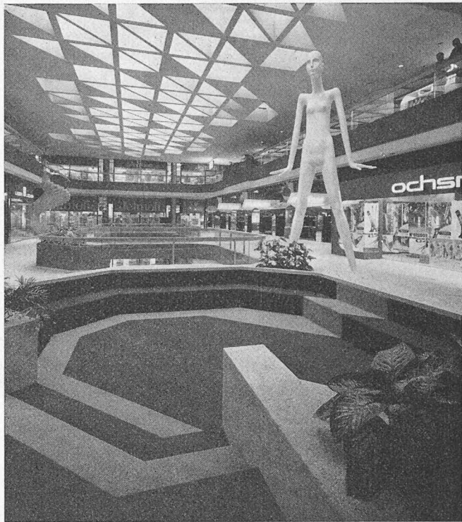
Sitzmulde (mittlere Verkaufsebene)

– «Einkaufszentren ja – aber weder in ländlichen Regionen, noch innerhalb von Agglomerationen auf der grünen Wiese und nicht als Überangebot, sondern nur bei Bedarf und in die bestehende Siedlungsstruktur integriert.» (D. Woronsky)