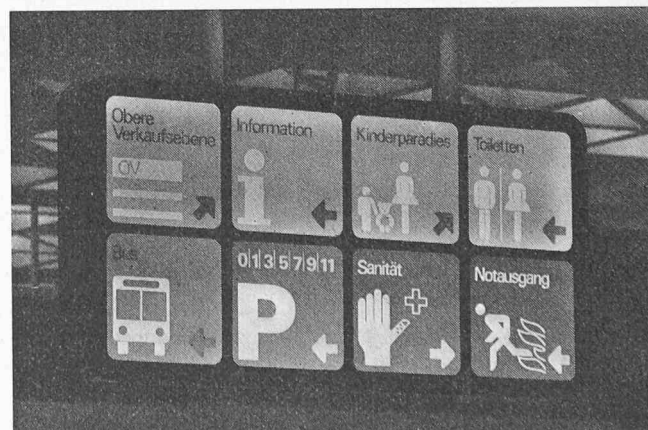
Baugraphik: interne Wegweiser mittels beleuchteten Pictogrammtafeln