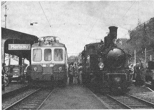
Alt und Neu begegnen sich in Herisau. Links moderne Komposition der Appenzeller-Bahn, rechts die von der RhB angekaufte Dampflokomotive G 3/4

Herisau stillgelegt. Durch die zunehmende Konkurrenzierung durch das Automobil, das in den zwanziger Jahren mehr und mehr Einzug hielt, wurde die finanzielle Lage der AB nicht besser. Trotzdem wurde damals mit der Elektrifikation der meterspurigen Linie in den Jahren 1932/33 das einzig Richtige getan. Am 22. April 1933 konnte die Bahn dem elektrischen Betrieb, Fahrleitungsspannung 1500 V Gleichstrom, übergeben werden. Gleichzeitig wurde es möglich, die Geschwindigkeit auf über 60 km/h zu erhöhen. Eine wesentliche Verbesserung der Betriebslage brachte schliesslich der Zweite Weltkrieg, denn die grossen Einschränkungen, die dem Automobilverkehr auferlegt wurden, waren den schienengebundenen Fahrzeugen von Nutzen.