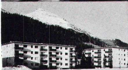
Überbauung Rietstrasse, Elektrizitätswerk der Landschaft Davos; total 33 Wohnungen; Anschlusswert ca. 400 kW