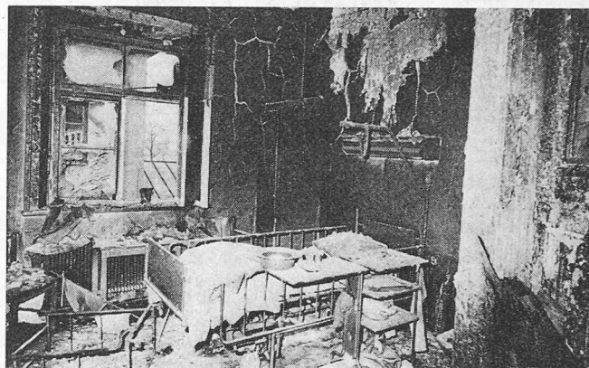
Ausgebranntes Patientenzimmer im St.-Erik-Spital, Stockholm

a) Hilflose, die sich nicht selbst retten können und deshalb im Ernstfall auf die Hilfe anderer angewiesen sind;