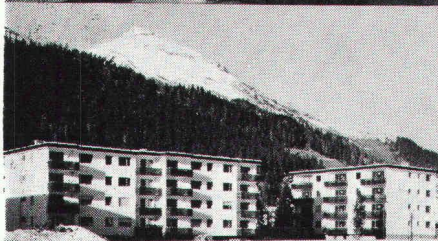
Überbauung Rietstrasse, Elektrizitätswerk der Landschaft Davos; total 33 Wohnungen; Anschlusswert ca. 400 kW

Star Unity AG Fabrik elektrischer Apparate Zürich, in Au/ZH Tel. 01 75 04 04