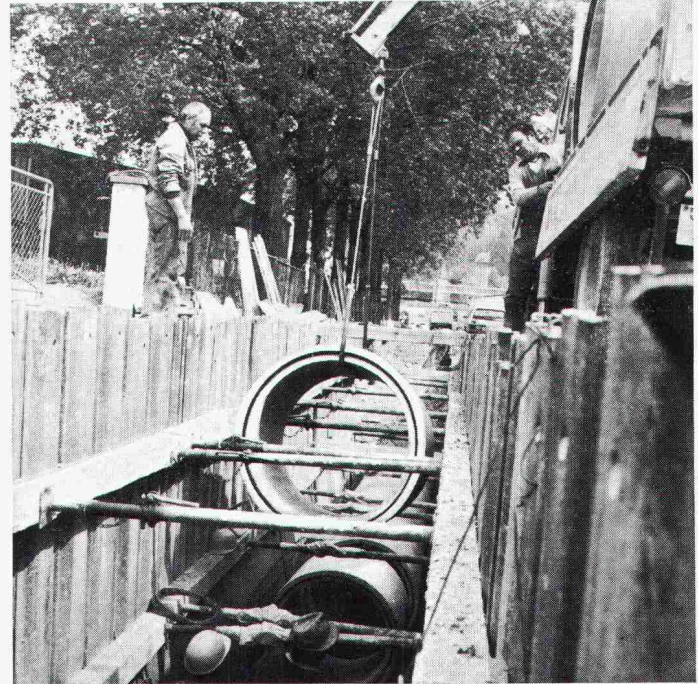
Abladen und Einsetzen von Betonröhren mit einmontierten «BFL-Mastix»-Bändern