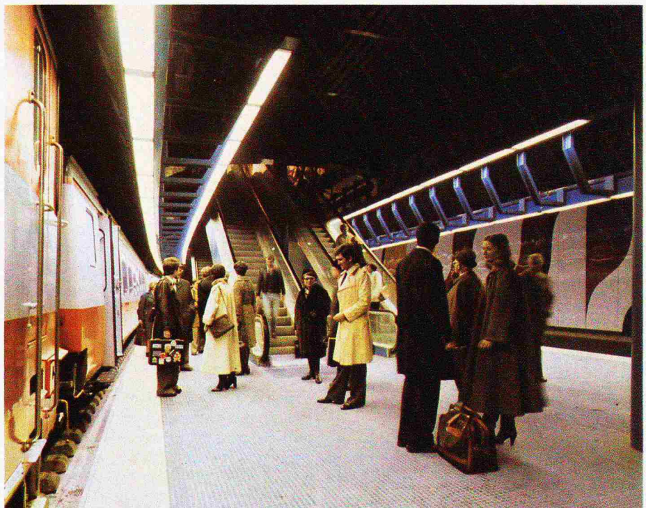
Bild 5. Rolltreppenaufgang vom Perrongeschoss in die Bahnhofhalle