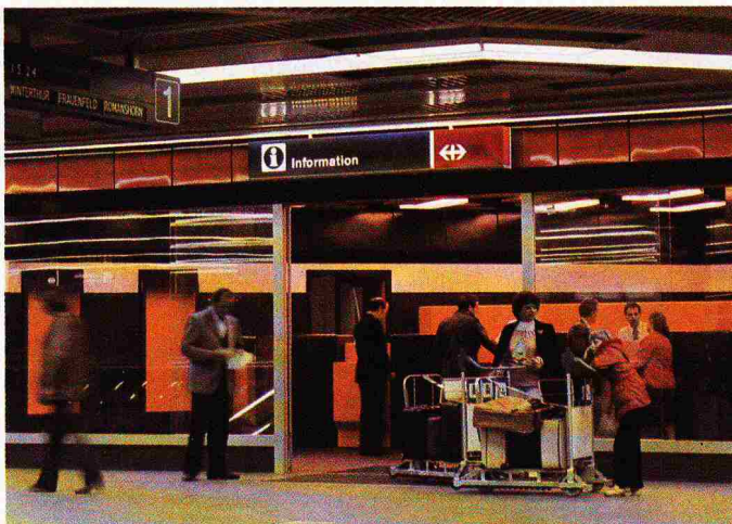
Bild 6. Informationsschalter