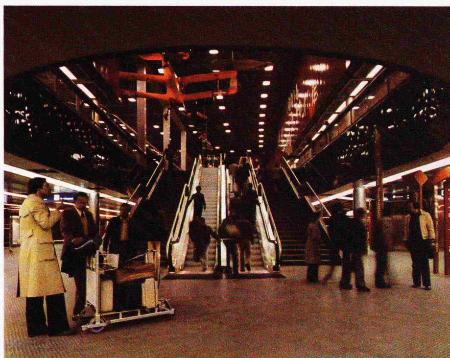
Bild 1. Hauptaufgang, Bahnhofhalle-Airport Plaza

Im Rahmen einer übergeordneten Projektorganisation war auch eine weitverzweigte Koordinationsarbeit zu leisten zwischen den direkt beteiligten Diensten der SBB, verschiedenen Ämtern des Kantons und der Gemeinde Kloten, dem kantonalen Polizeikommando und der Flughafenfeuerwehr,