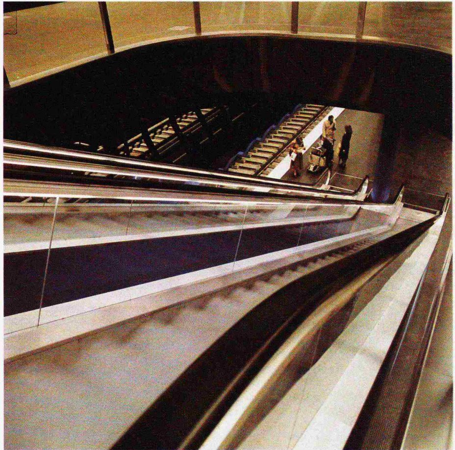
Bild 2. Rolltreppe zwischen Perrongeschoss und Bahnhofhalle

Damit der Reisende erkennt, in welcher Richtung er den Ausgang findet, sind die Rolltreppenlöcher heller beleuchtet und, im Gegensatz zur sonst hier vorherrschenden blauen Farbe, mit roter Farbe eingefasst, die in der darüberliegenden Bahnhofhalle dominiert