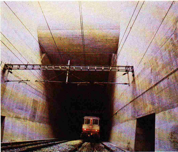
Bild 9. Entspannungsschacht