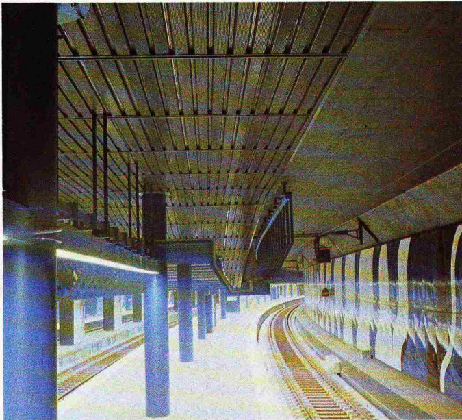
Bild 3. Perrongeschoss mit Vollstahlstützen