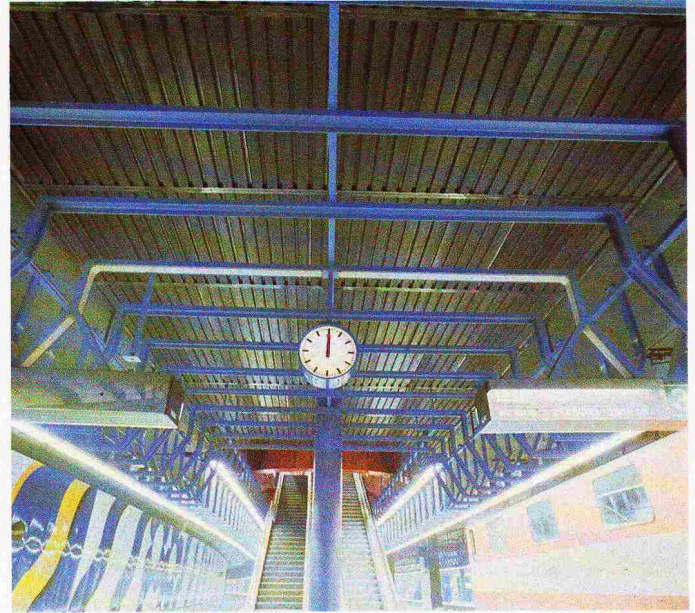
Bild 4. Rippenkonstruktion über dem Perrongeschoss