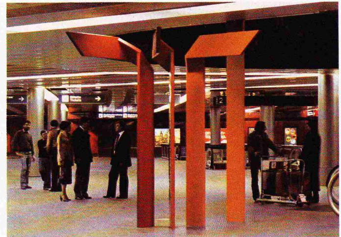
Bild 7. Bahnhofshalle

(Bild 5). In ihr wurde grosses Gewicht auf eine gute Ausstattung sowie einen sorgfältig durchgestalteten Innenausbau gelegt.