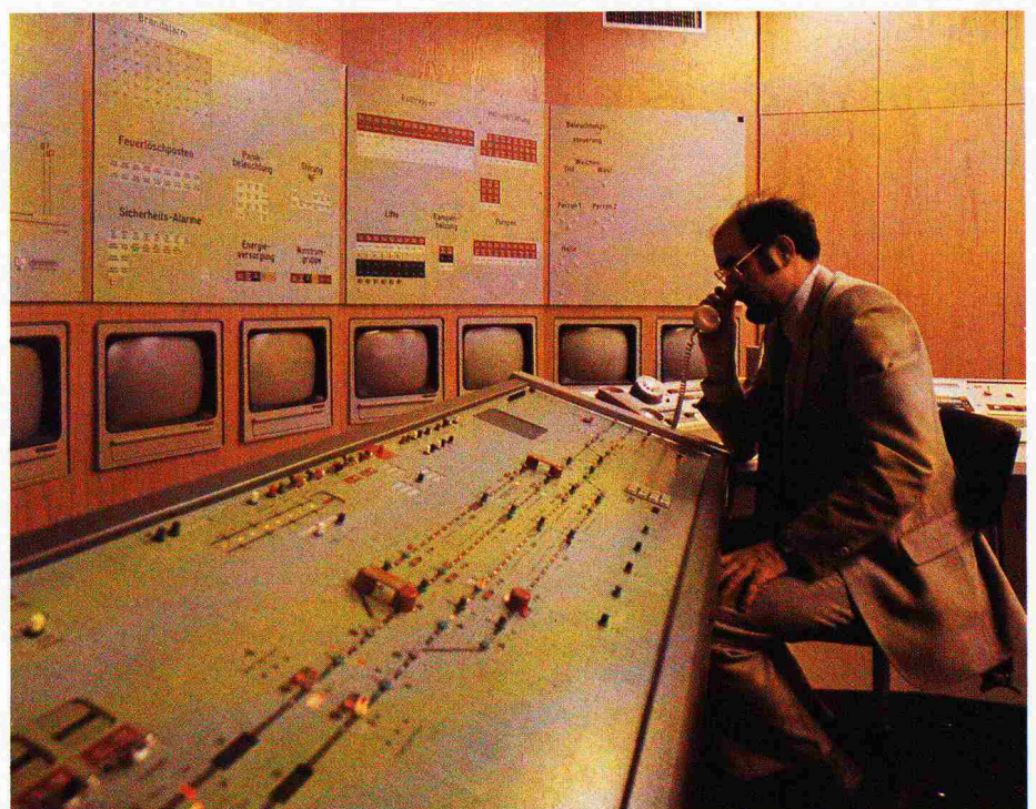
Bild 8. Leitstelle

Die administrativen und technischen Räume der SBB sind im Osten des