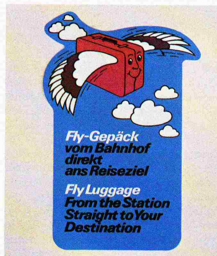
Bild 2. Fly-Werbeposter. Zufrieden schmunzelnd wirbt der fliegende Koffer für die weltweite Gepäckabfertigung Bahn-Flugzeug

Stadt, die Fahrt zum Flughafen, der Abschied und endlich der Check-in – das alles ist ohne Gepäck bedeutend angenehmer. Auch der schweizerische Ferienreisende schätzt es, wenn er am Vorabend des Reisetages sein Gepäck aufgeben kann. Damit sind die Reisevorbereitungen abgeschlossen, und ohne Gepäck wird der Reisetag bereits zum ersten Ferientag. Gegen 5000 Fly-Gepäcksendungen in den letzten drei Monaten und das lebhaftere Interesse ausländischer Bahn- und Fluggesellschaften am Fly-Projekt deuten denn auch darauf hin, dass mit dem Fly-Ge-