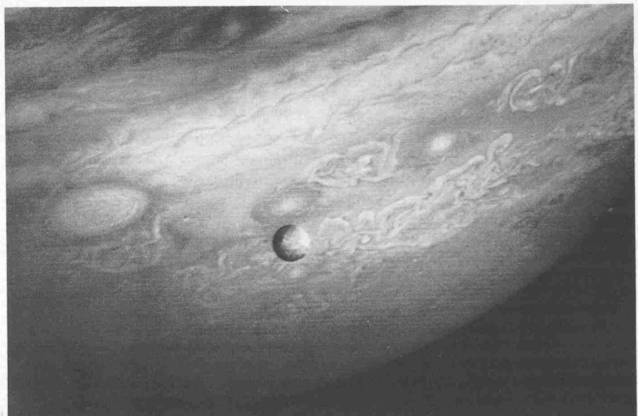
Der wohl aktivste Himmelskörper unseres Sonnensystems ist der Jupiter-Mond Io – hier von der amerikanischen Raumsonde Voyager 2 aus ungefähr 12 Millionen Kilometer Entfernung vor der turbulenten Gashülle der südlichen Hemisphäre Jupiters fotografiert. Bei heftigen Vulkanausbrüchen auf Io, er ist etwa so gross wie der Erd-Mond, werden winzige Ascheteilchen ausgeworfen, die auf Umwegen den Ring um Jupiter verursachen

Winzige Teilchen mit Radien kleiner als ein Zehntel Mikrometer (1 Mikrometer = 1 Zehntausendstel Zentimeter) in der Vulkanasche haben jedoch, so berechneten Grün und Morfill, durchaus eine Chance, den Anziehungsbereich Ios zu verlassen. Sobald die Staubpartikel nämlich über die dünne, bis in ungefähr 100 Kilometer Höhe reichende Atmosphäre Ios hinausgeschleudert werden, laden sie sich innerhalb von Sekunden elektrisch auf. Das geschieht entweder durch das Ultraviolett-Licht der Sonne (Photoeffekt) oder – dieser Prozess dürfte vorherrschen – durch das Bombardement energiereicher Plasmateilchen, die in den starken Strahlungsgürteln des Magnetfeldes um Jupiter eingeschlossen sind. Wie die Erde, weist nämlich auch der Jupiter eine weit in den Weltraum hinausreichende Magnethülle auf,