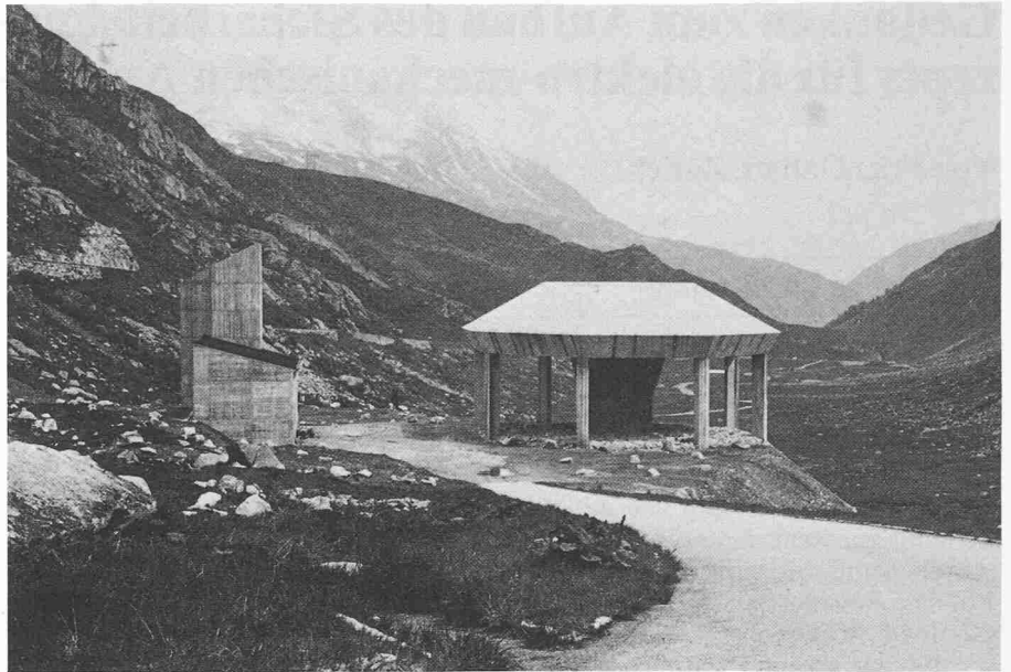
Bild 3. Aussenbauwerk Guspisbach, Ansicht von Süden

Da die vorhandenen Platzverhältnisse der architektonischen Gestaltung mehr Spielraum übrig liessen als z.B. beim Schachtkopf Bätzberg, treten die archi-