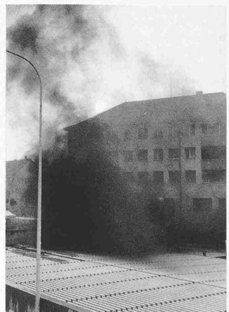
Bild 6. Aubruggtunnel Zürich, Brandversuche: Austritt des Rauchs aus dem mit Gittern überdeckten Tunnelende