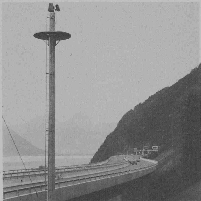
Vollbewegliche Mastenkamera. Sie steht nördlich des Tunnels und überblickt einen grossen Teil des Lehnenviaduktes

An die Robustheit der Kameras sind hohe Anforderungen gestellt. Sie müssen resistent sein gegen Abgase von Verbrennungsmotoren, gegen Schwefel, alkalische Wasser, Streusalz und Strassenstaub, gegen Waschmittel bei der Tunnelreinigung und gegen Temperatur- und Feuchtigkeitsunterschiede. Die Kameras sind zudem gegen elektrische und magnetische Felder abgeschirmt. Kameraanschluss und Kamerabefestigung sind so ausgelegt, dass eine schnelle Demontage und Montage im Wartungsfall gewährleistet ist.