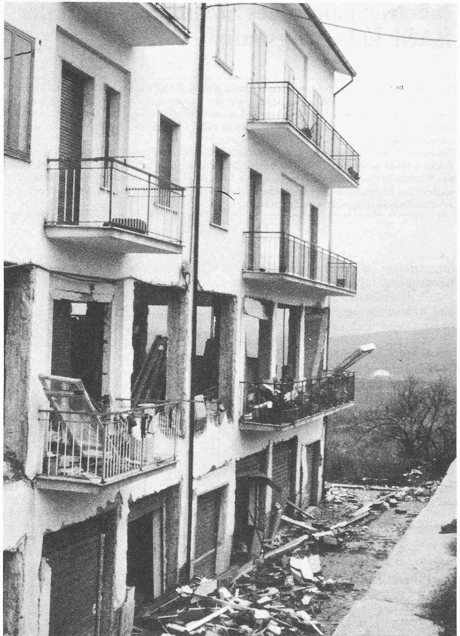
Bild 4. Stahlbetonskelettbau in S. Angelo dei Lombardi. Die Füll- und Zwischenwände in den untersten zwei Geschossen sind grösstenteils zerstört. Bedeutende Schäden an der Tragstruktur

Die an Strassen beobachteten Schäden waren im allgemeinen nicht schwerwiegend. Vollständige Strassenunterbrüche infolge des Erdbebens traten nur sehr selten auf. Hingegen führten, namentlich im Epizentralgebiet Setzungen des Dammkörpers bei Brückenwiderlagern, Bachdurchlässen und Unterführungen zu Unterschieden in Fahrbahnhöhe von bis zu 40 cm. Diese wurden unmittelbar nach dem Beben durch angeschüttete Rampen provisorisch repariert. Entsprechend waren diese Strecken zum Teil nur mit stark reduzierter Geschwindigkeit befahrbar. Vielerorts konnten auch breite Risse im Belag