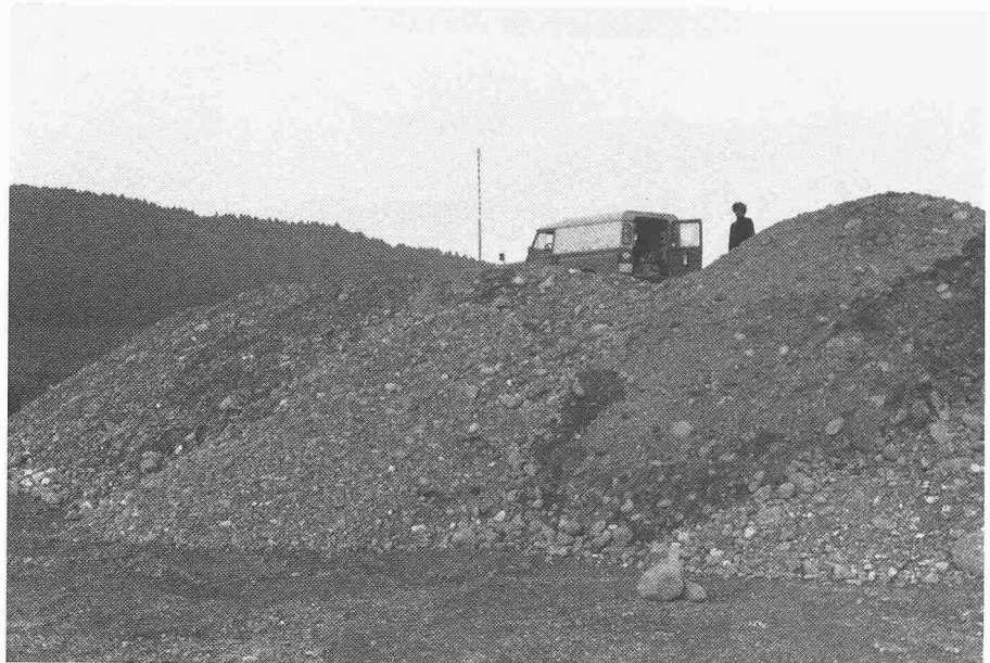
Bild 3. Hang vor dem Eingriff