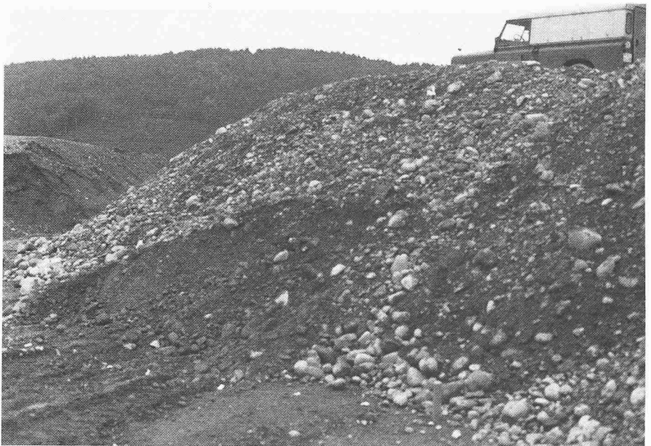
Bild 4. Hang nach Entnahme der ersten zwei Trax-Schaufeln