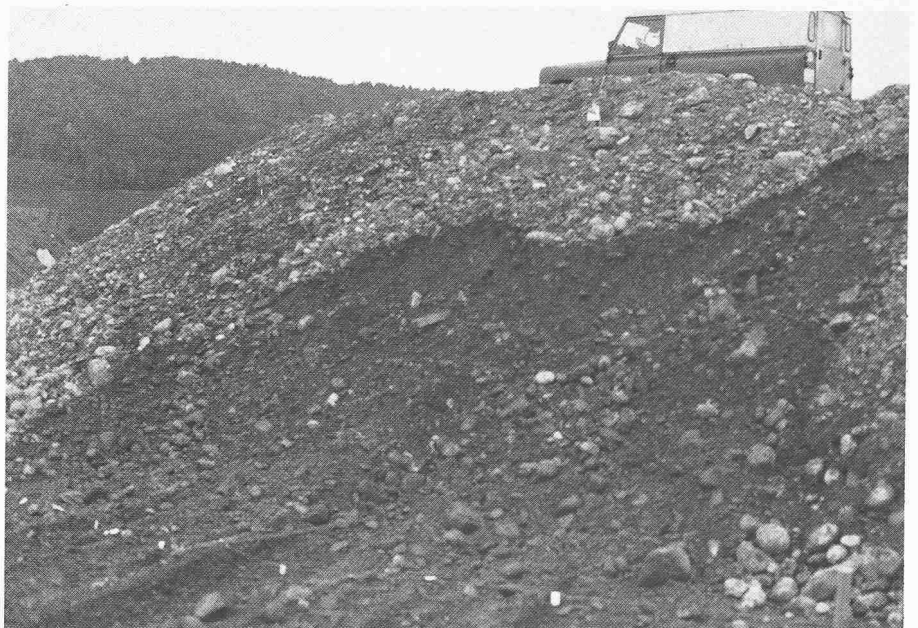
Bild 5. Hang nach der zweiten Hangfussentlastung