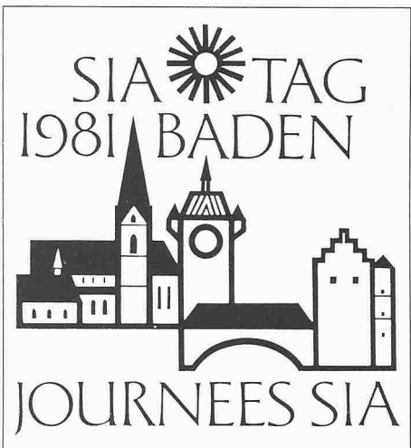
SIA-Tag 1981 in Baden 22.-23. Mai

Der Vorstand hofft, dass dieses Programm überall Anklang findet, und freut sich auf eine möglichst rege Teilnahme.