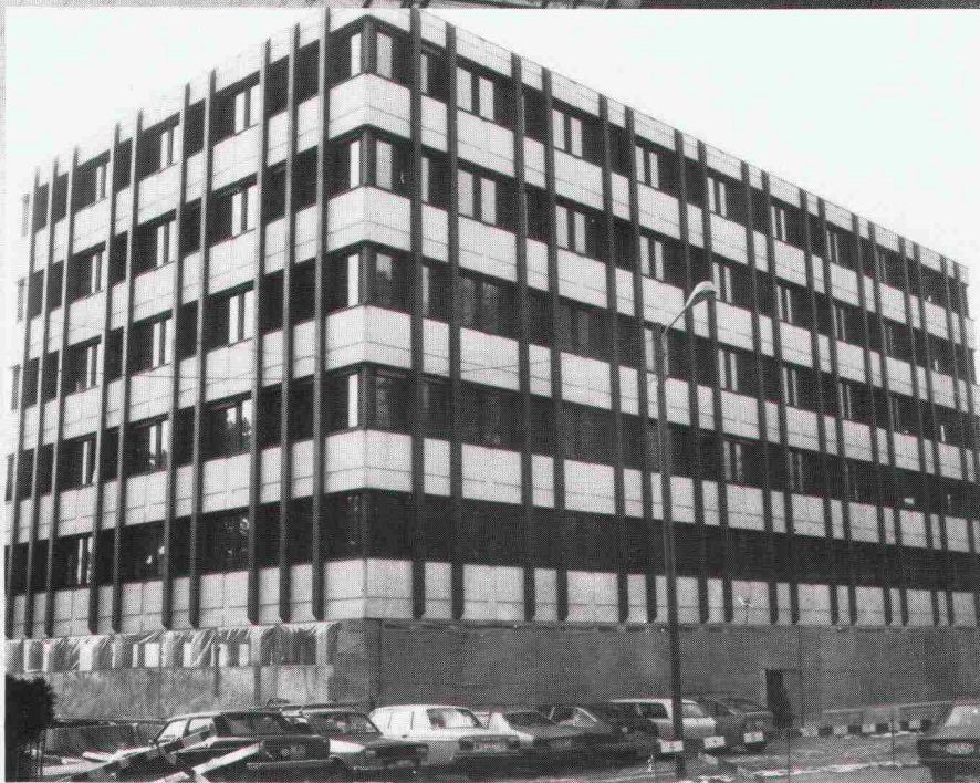
Verwaltungs- und Geschäftsgebäude der Publicitas AG, Lausanne. Dieses Bauvorhaben war bei der WAADT versichert.