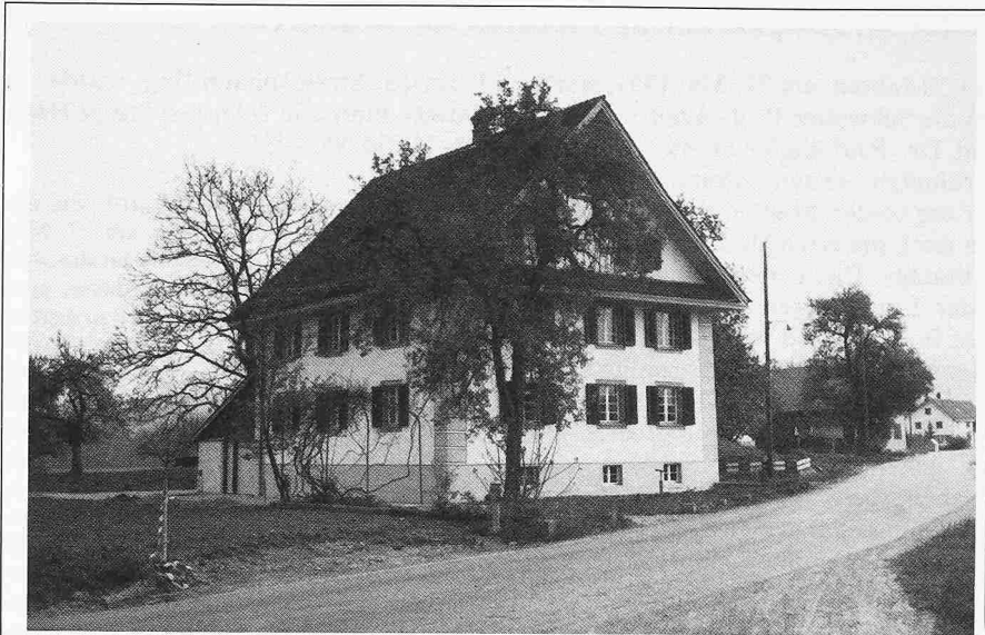
Zieglerhaus in Rottenschwil

Vor allem wollen die dortigen Länder gegen die Verschmutzung des Golfs durch Tankeröl vorgehen, schreibt «Earthscan», eine von der UNEP-Organisation unterstützte Informationsschrift. Bis kurz nach dem Ausbruch des Golfkrieges passierten täglich rund einhundert Tankschiffe die Strasse von Hormuz, um in den Golfhäfen Öl aufzunehmen. Über sechzig Prozent des auf dem Seewege transportierten Öls stammt aus den Golfstaaten. Die Ölverschmutzung des Meeres wird vor allem dadurch hervorgerufen, dass