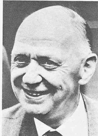
Jakob Ackeret (1898–1981)

Wenn der wesentliche Sinn des Lebens darin liegt, das zu werden, wozu uns unsere Anlagen bestimmen, so hatte Ackeret den Ruf des