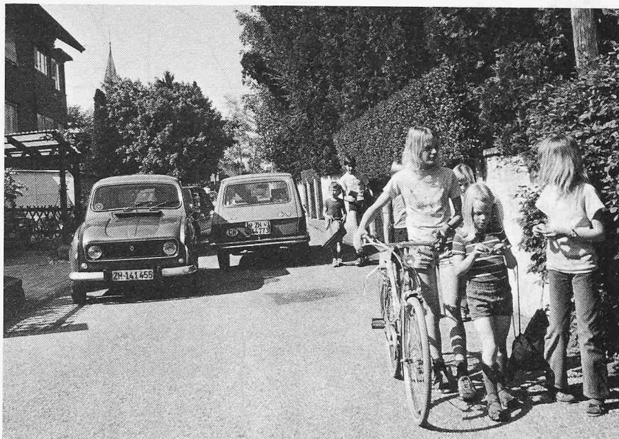
Auf diesem Schulweg ist die Sicherheit der Kinder nicht mehr gewährleistet. Ein einziger unbedachter Schritt kann hier schon zu einem verhängnisvollen Unfall führen. Der Schulweg muss entweder von dieser Strasse weggeführt werden oder mit baulichen oder organisatorischen Massnahmen gesichert werden

Mit Blick auf die Wohnlichkeit von Gemeinde oder Quartier und auf die Sicherheit der Fussgänger sollten künftig bei der Orts-, Quartier- und Verkehrsplanung von Anfang an Vorkehren zur Sicherung und Erstellung eines angemessenen Fusswegnetzes getroffen werden.