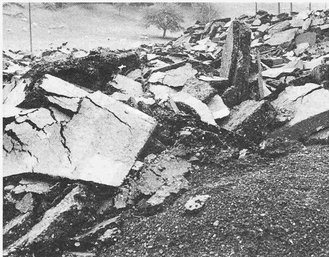
Bild 1. Deponie von Belagsaufbruch für das Recycling