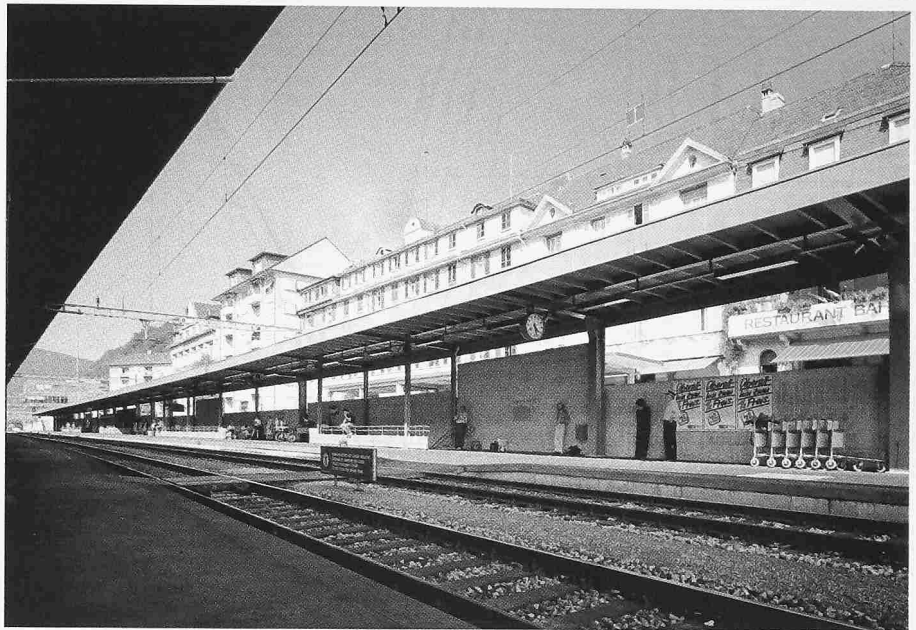
Bild 2. Der neue Aussenperron, links das neue Zentralstellwerk

Zu den bisher aufgeführten «Zweckbauten», denen zusätzlich der gesamte Gleisumbau einschliesslich Unterbausanierung sowie die Verlängerung aller alten, bestehenden Perronanlagen angehörten, gesellten sich im Bahnhofbereich noch einige «Komfortbauten», wie die Erhöhung der Perronkanten auf das Standardmass 300 mm über SiOK, der Ersatz je eines Treppenaufganges pro Perron durch eine Rampe, der Neubau der Aufzugsanlagen für die PTT sowie weitere, in den anderen Fachdienstbeiträgen näher beschriebene Bauten.